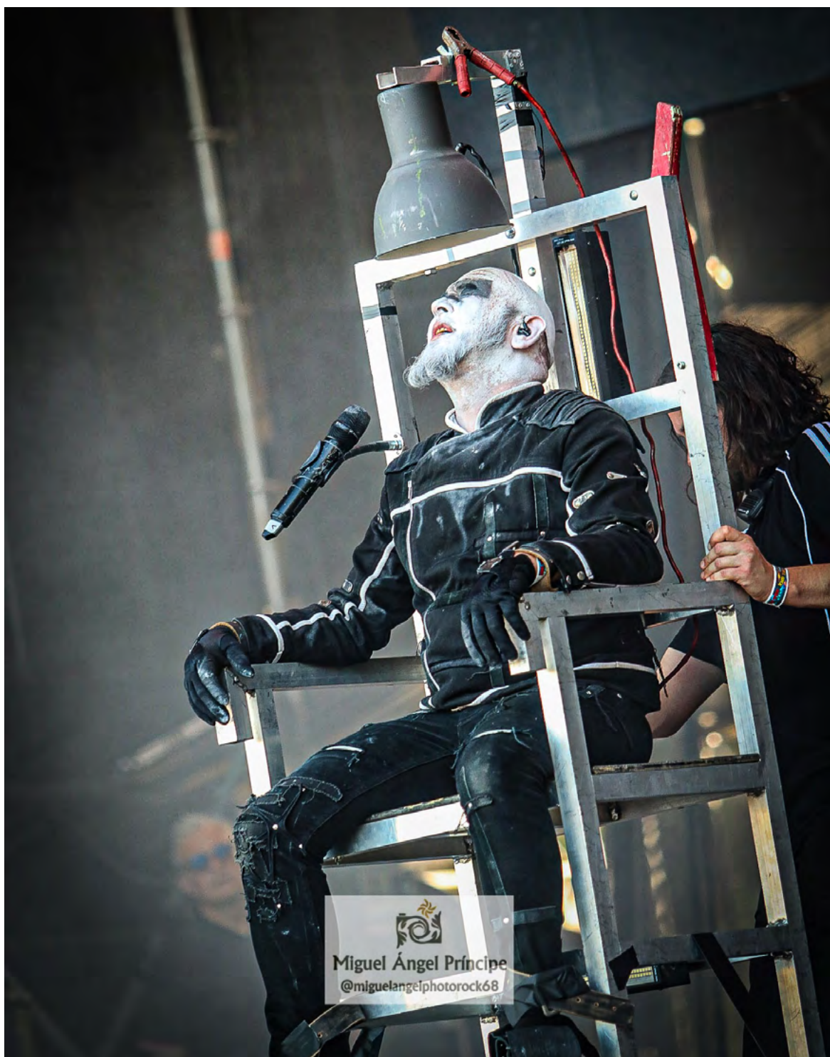
Miguel Ángel Príncipe @miguelangelphotorock68

El vocalista hizo referencia durante su actuación en numerosas ocasiones a los lazos irrompibles que le unen con nuestro país, haciendo varios intentos por demostrarnos en castellano la historia que le une a España y como vivió durante muchos años en nuestra tierra, llevándose de la misma un más que grato recuerdo lo que es posible le llevase a gestionar una de sus mejores actuaciones cargada de