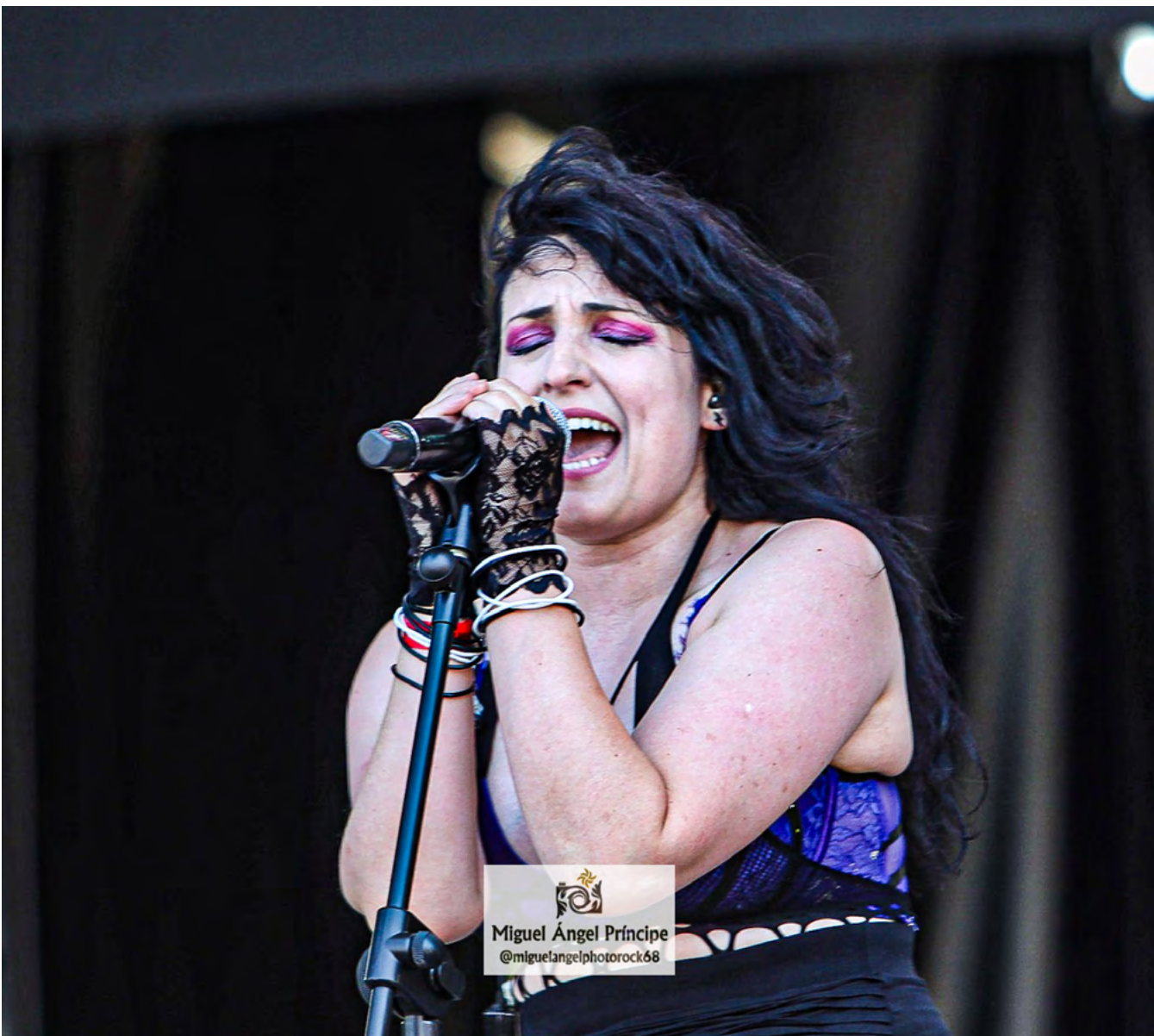
Miguel Ángel Príncipe @miguelangelphotorock68

costó arrancar pero que una vez puesto en marcha, no paró de ovacionar a ambas apreciando en CHEZ KANE un ortodoxo Hard Rock que exploró acertadamente un repertorio basado en sus trabajos Chez Kane y Powerzone donde la vocalista se empleó a fondo para crear un ambiente de elegancia A.O.R. y melodías esencialmente ochenteras, una época de la cual la cantante ha confesado en varias ocasiones estar enamorada y así lo manifestó sobre el Cartagena Stage donde pudo presumir tanto de garganta como de actitud consiguiendo romper ese hielo inicial que siempre